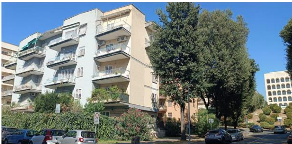
ROMA - zona EUR / Colosseo Quadrato - Appartamento di 7 vani al 2° Piano con Box auto

Oppure chiamare il Numero Verde: 800.257.977