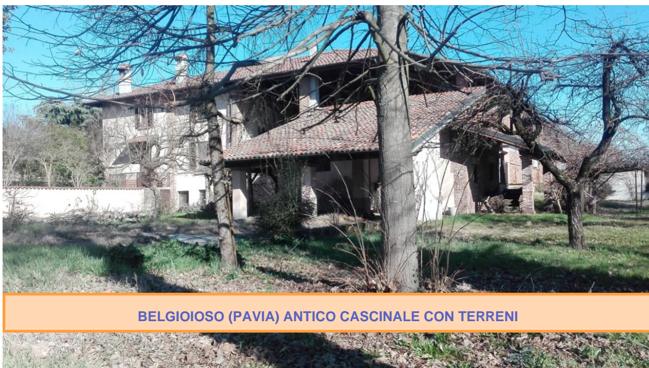
BELGIOIOSO (PAVIA) ANTICO CASCINALE CON TERRENI